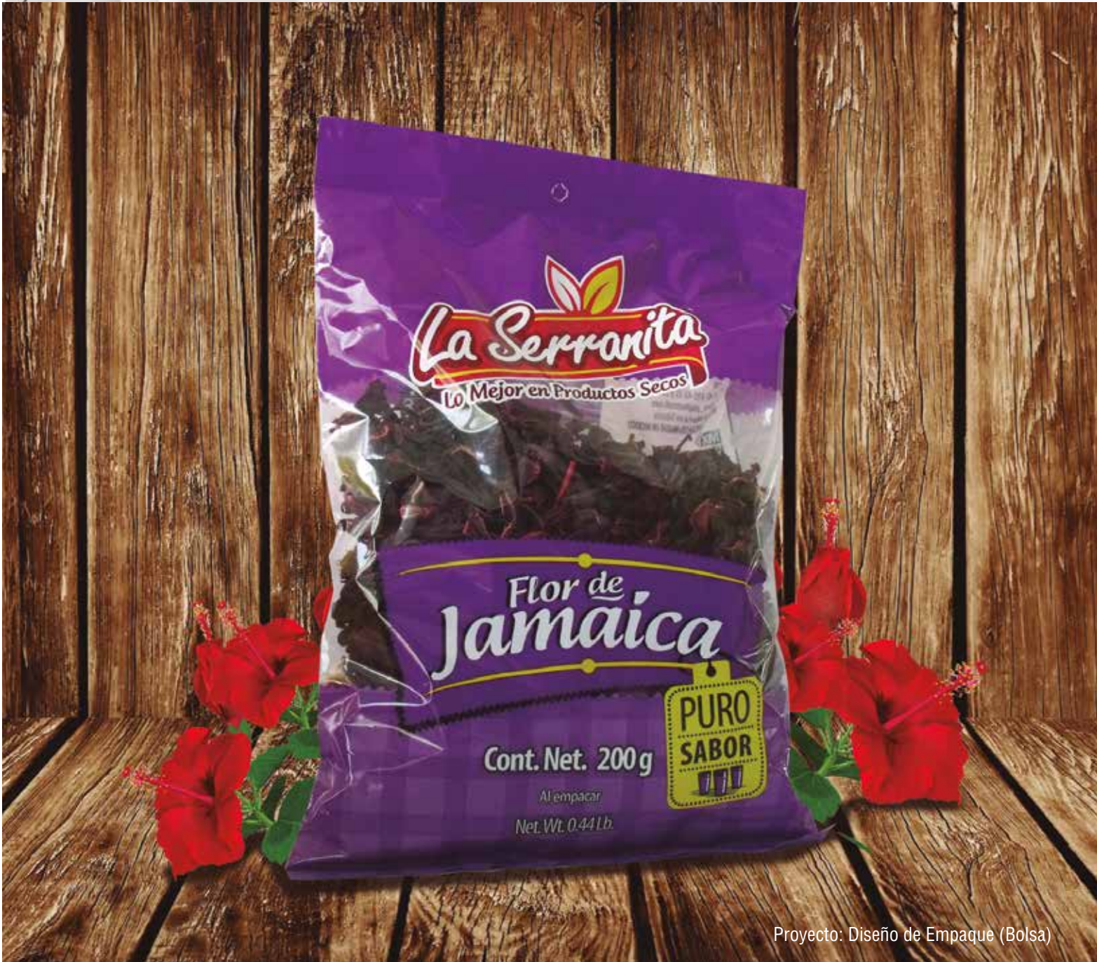
Proyecto: Diseño de Empaque (Bolsa)