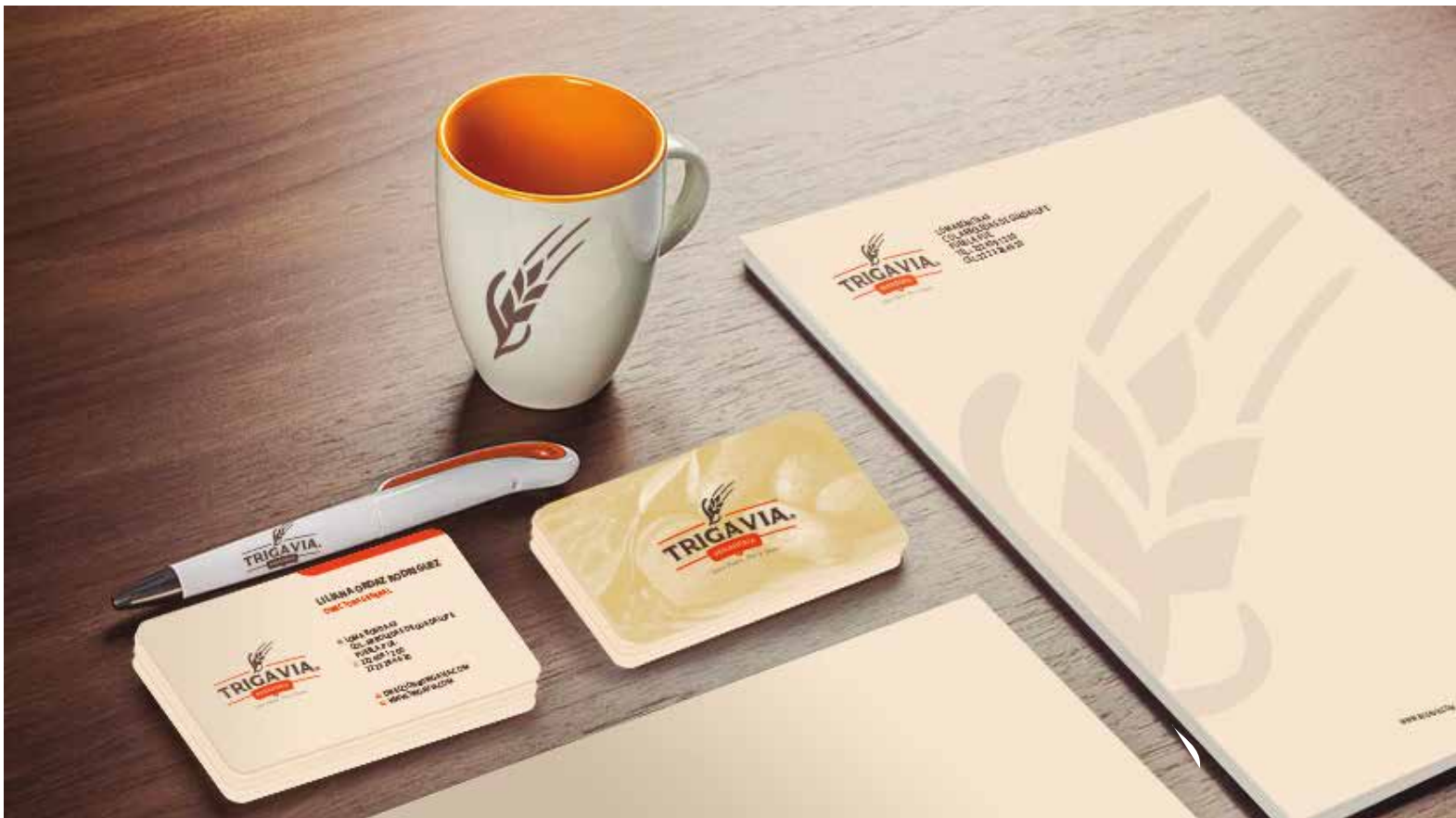
Proyecto: Logotipo aplicado a Programa de identidad Corporativa

A Continuación una Breve Muestra de lo que podemos hacer para Ayudarlo a Construir Su Marca: